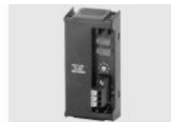
PRO COM IO-Link